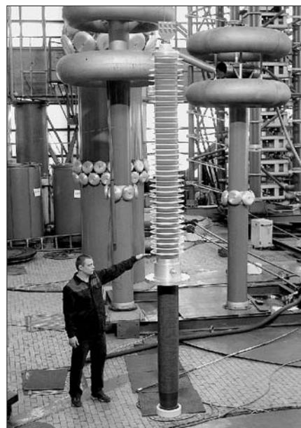
Рис. 3. Высоковольтный ввод 220 кВ с внутренней RIP и внешней полимерной изоляцией на испытаниях

Все вводы получили сертификаты соответствия требованиям ГОСТ 10693-81 и публикации МЭК 60137:2003 в органе по сертификации средств информатизации, приборостроения, медицинской техники и электрооборудования – Всероссийском научно-исследовательском институте стандартизации и сертификации в машиностроении. Сертификационные испытания проведены в аккредитованном Испытательном центре высоковольтного оборудования Энергетического института им. Г. М. Кржижановского (ЭНИН).