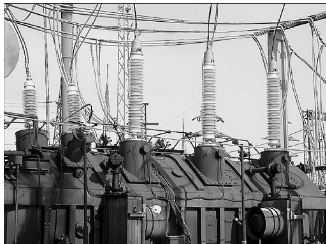
Рис. 2. Высоковольтные вводы 220 кВ с внутренней RIP-изоляцией на трансформаторе мощностью 200 МВ·А

Для предотвращения возможных деформаций и растрескивания в состав компаунда были введены в экспериментально определенной пропорции модификаторы. При изготовлении изоляционных остовов на напряжение 220 кВ и выше могут использоваться эластичные материалы в качестве демпфирующего слоя между центральной трубой и изоляционной бумагой. Полученные результаты позволяют сделать заключение, что именно подбор состава компаунда и тщательный контроль за соблюдением технологиче-