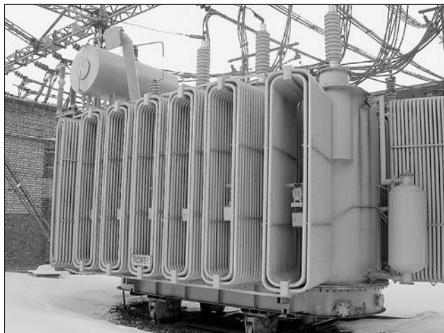
Рис. 1. Высоковольтные вводы 110 кВ с внутренней RIP-изоляцией на трансформаторе мощностью 63 МВ·А

смола, отвердителя, модификатора и катализатора. Определены оптимальные соотношения “бумага – компаунд”, режимы и параметры выполнения главных технологических операций: плотность намотки изоляционной бумаги, скорость подачи компаунда, температура, уровень вакуума, избыточное давление. Получены 10 патентов на изобретения и полезные модели по конструкции изоляционных остовов, вводов, установок для изготовления остовов из бумажной изоляции, пропитанной смолой. Выработаны технические требования к установкам для промышленного производства. Разработано, изготовлено и отлажено необходимое технологическое оборудование и оснастка. Установка для подготовки компаунда спроектирована и изготовлена по техническим требованиям ЗАО “Мосизолятор” одной из ведущих западных фирм по производству установок для смолотитья под вакуумом для предприятий электротехнической промышленности.